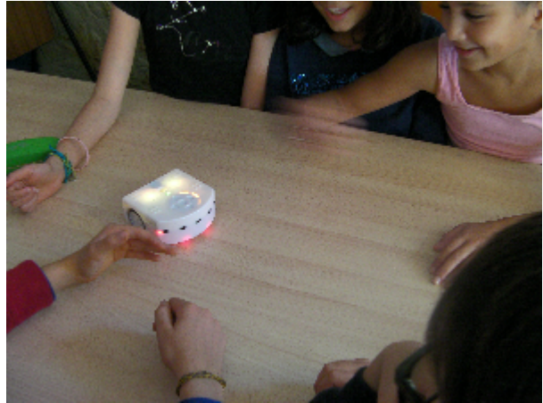
Classe de Nathalie Pasquet (Paris)

Comme expliqué à la page précédente, Cette séquence robotique au cycle 2 reprend, en 2 à 3 séances, la séquence de découverte de Thymio proposée en cycle 1 avec quelques nuances décrites ci-dessous, puis la prolonge par une première approche de la programmation de Thymio à l'aide du langage VPL. Nous proposons en outre de remplacer les dessins d'élèves par le remplissage individuel de la Fiche 23 proposée ici, ainsi que par la création de posters pour toute la classe.